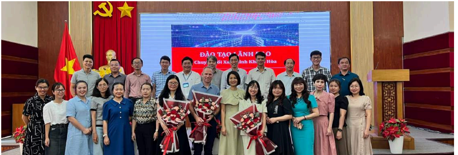
Green Transformation Leadership Training Program for Khanh Hoa Province