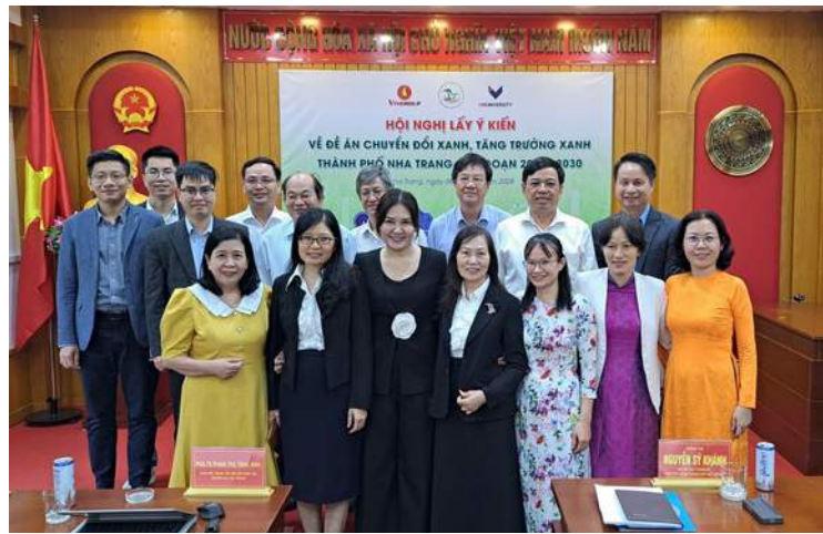
Conference to collect opinions on Green Transformation and Green Growth Master Plan for Nha Trang City