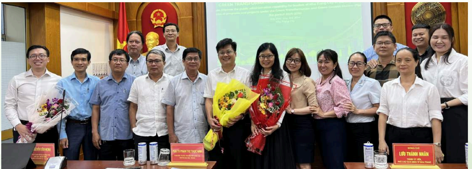
Green Transformation, Green Growth Leadership Training Program for Nha Trang City