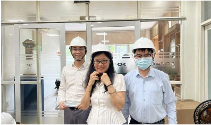
VinUni Taskforce's field trip to Dac Loc Industrial Park in Nha Trang