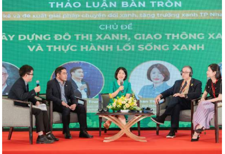
International Conference on Green Transformation, Green Growth for Khanh Hoa Province - Model of Nha Trang City