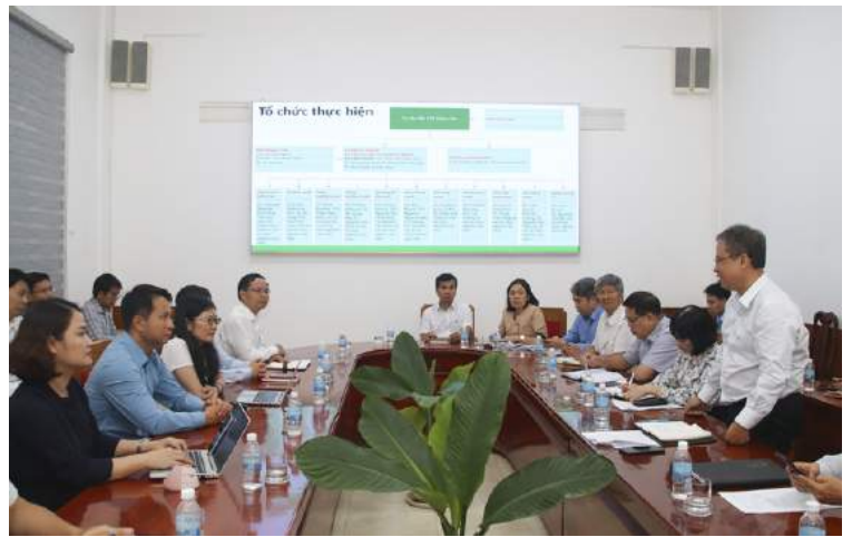
Meeting between VinUni and Nha Trang Taskforce on the Master Plan's progress