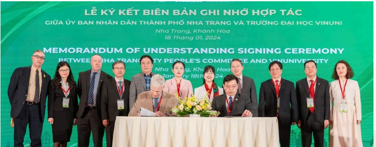
Memorandum of Understanding Signing Ceremony between VinUniversity and Nha Trang City People's Committee