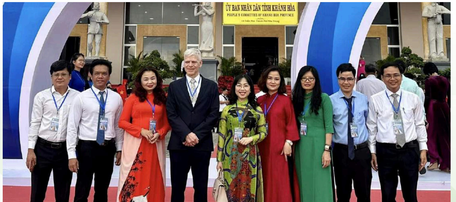
VinUni's Taskforce on Nha Trang's 100th year Anniversary