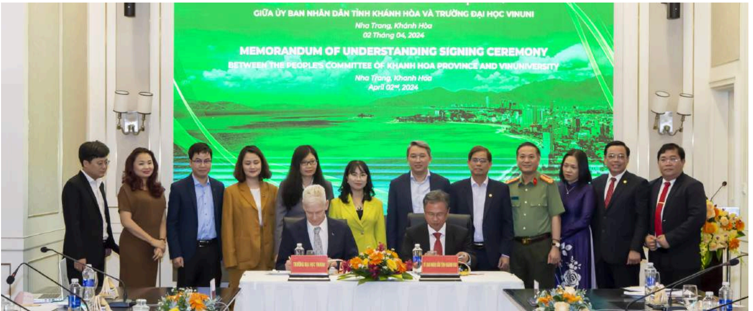
Memorandum of Understanding Signing Ceremony between VinUniversity and Khanh Hoa Provincial People's Committee